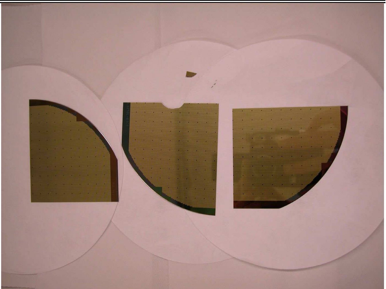
Figure 1 : échantillons reçus

Ces résultats ont été obtenus en appliquant les procédures standards du laboratoire et sont seulement représentatifs des échantillons tels que réceptionnés. La responsabilité d'Air Liquide – Balazs Analytical Services (« Balazs ») ne peut excéder le montant payé pour ce rapport. En aucun cas Balazs ne pourrait être tenu responsable de dommage consécutif à l'émission de ce rapport. Le client accepte de ne pas utiliser le nom de Balazs dans des rapports contenant des résultats obtenus par des essais réalisés par Balazs sans obtenir au préalable l'accord écrit de Balazs pour un tel usage. Le présent rapport ne peut être reproduit, excepté en totalité, sans l'accord écrit de Balazs.